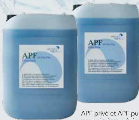
APF privé et APF public: pour piscines privées et piscines publiques