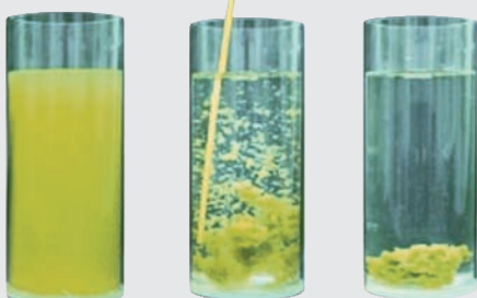
Esempio di processo di flocculazione

Nessun singolo flocculante può rimuovere tutte le sostanze inquinanti dall'acqua. APF è una precisa combinazione di 6 differenti elettroliti e poli-elettroliti per coprire il più ampio spettro possibile. Sostanze disciolte in acqua causano fino all'80 % del bisogno di ossidante. Tutto quello che può essere filtrato non ha bisogno di essere ossidato. Quando viene utilizzata una corretta flocculazione in combinazione con AFM®, i consumi di cloro e la produzione di derivati dal cloro indesiderati, sono ridotti fino all'80 %.