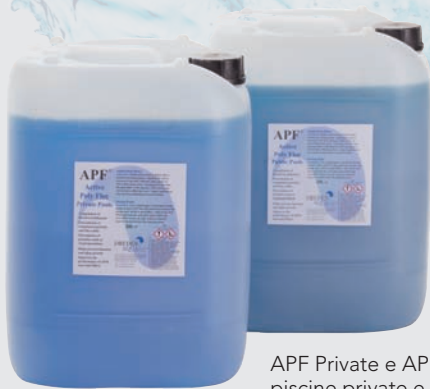
APF Private e APF Public per piscine private e pubbliche

Per la miglior coagulazione e flocculazione