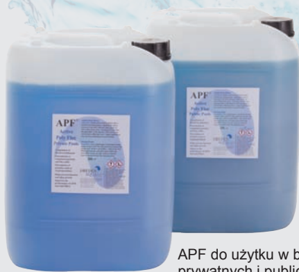
APF do użytku w basenach prywatnych i publicznych

Efekt najlepszej koagulacji i flokulacji