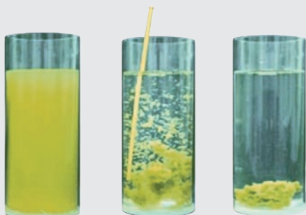
Przykład procesu flokulacji

Żaden pojedynczy flokulant lub koagulant nie może usunąć z wody wszystkich zanieczyszczeń. APF jest precyzyjnym połączeniem 6 różnych elektrolitów i polielektrolitów w celu zapewnienia możliwie najszerszego zakresu działania. Rozpuszczone składniki wody stanowią 80% zapotrzebowania na dezynfekcję a zawieszona cząstki stałe około 20%. Nie wszystko, co jest filtrowane wymaga utleniania, np. zanieczyszczenia nieorganiczne. Przy prawidłowej flokulacji w połączeniu z AFM®, zużycie chloru i tworzenie niepożądanych produktów ubocznych dezynfekcji zmniejsza się nawet do 80 %.