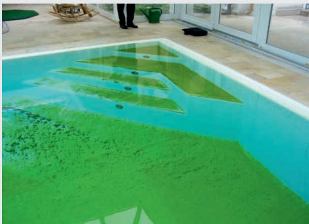
Basen z silnie rozwiniętą kolonią glonów

NoPhos jest naturalnym produktem, który można bezpiecznie stosować w basenach publicznych i prywatnych, a także w basenach naturalnych, stawach akwariach i fontannach. NoPhos jest naładowanym jodem, który reaguje z fosforem tworząc nierozpuszczalny osad, który usuwa się za pomocą AFM®, lub tworzy on łatwy do usunięcia obojętny osad na dnie zbiornika.